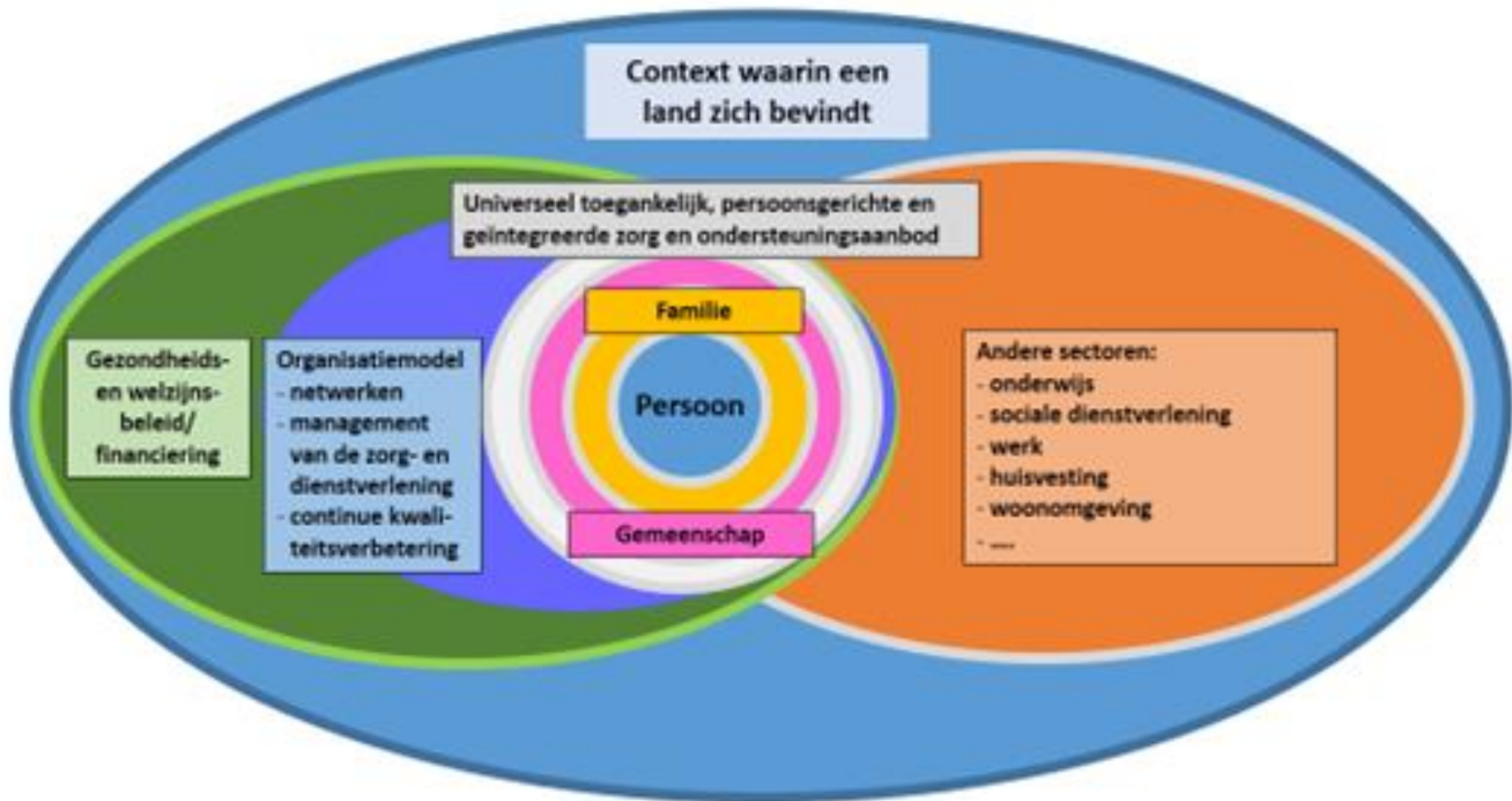
Conceptueel kader voor persoonsgerichte en geïntegreerde zorg en ondersteuning